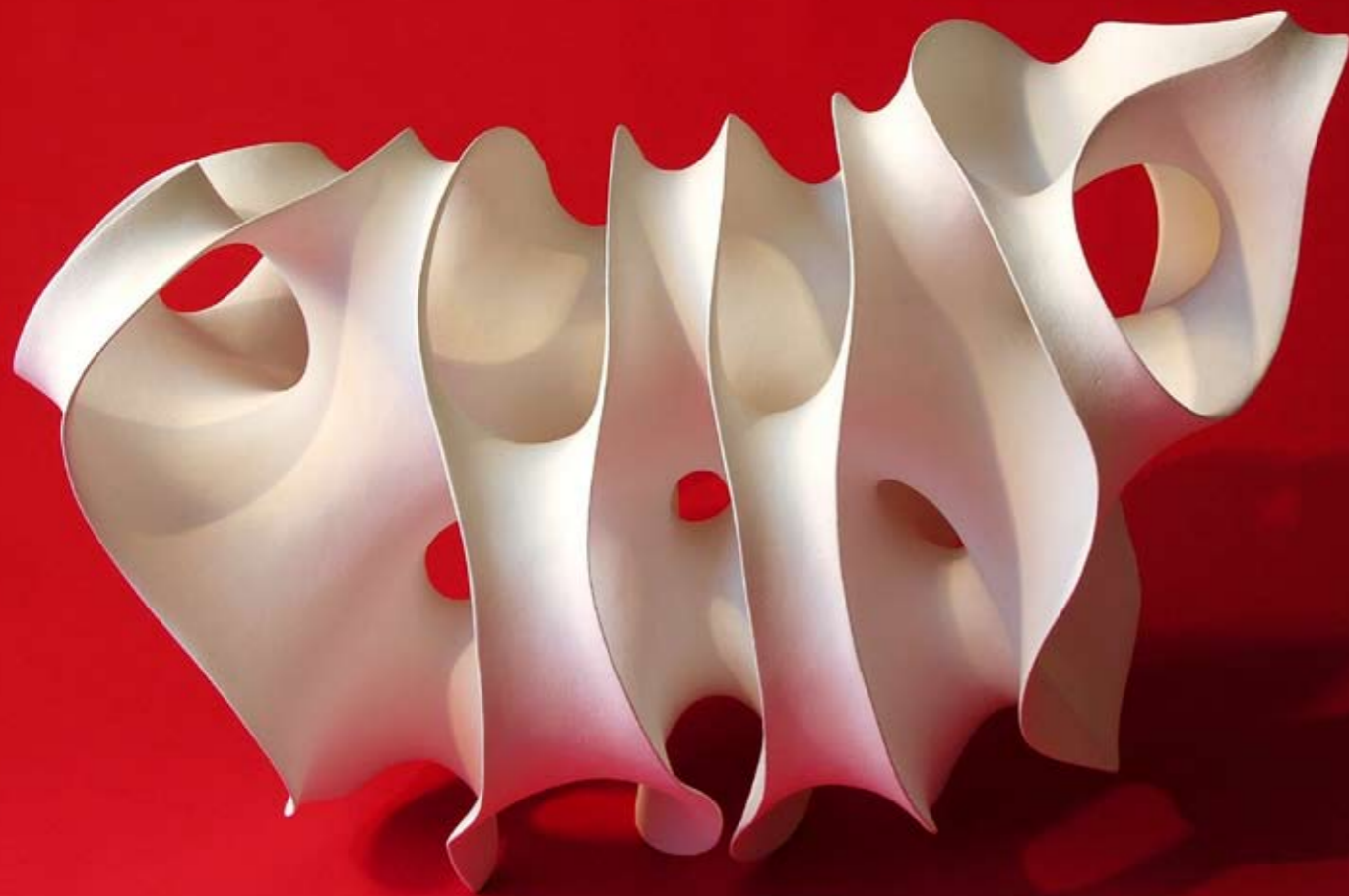
Stoneware. Eva Hild. "Det täta rummet är upplöst; här flödar luft och ljus. Förgrening och sammansmältning; i ständig rörelse. Drag åt alla håll som söker, lyfter och landar. Det inre hittar ut. Komplexitet och enkelhet i en och samma form." Keramik.